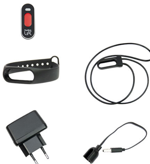
Figur 1 ELLA, armband, hållare med säkerhetsnöre, laddare och laddkabel