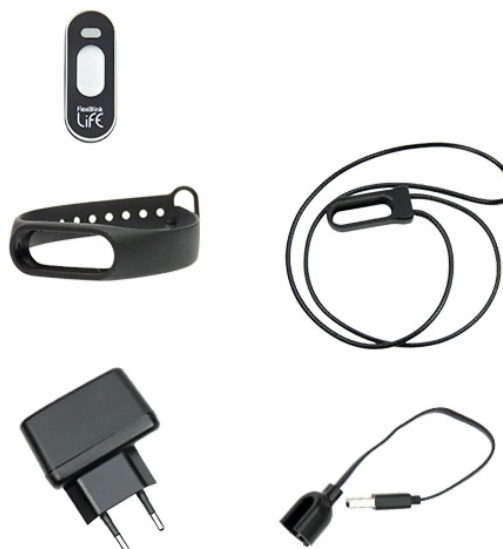
Figur 1 ELLA, armbånd, holder med sikkerhetssnor, lader og ladekabel