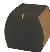
MIKLAD m/ 1 ladebrønn

Slå av senderen. Sett den i en ladebrønn i mikrofonladeren (MIKLAD1). Kontroller at indikatorlampen på laderen tennes idet senderen settes i ladebrønnen. Lampen på laderen lyser med fast, rødt lys under ladning, og skifter til fast, grønt lys når batteriet er helt oppladet.