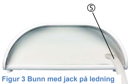
Figur 3 Bunn med jack på ledning