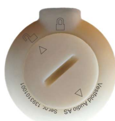
Lokket er nå ulåst og kan vippes ut.