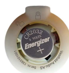
Batteriet legges i batterilommen

Sett batterilokket på plass. Med mynten trykker du lokket litt ned og vrir det mot høyre (med klokka) til pilen peker direkte på symbolet for låst batterilokk.