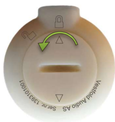
Åpne: Vri mot venstre.

Batterilokket åpnes eller lukkes ved å sette en passende mynt i sporet og vri. Batteriet har to store flater. På den ene siden er det tekst. Legg batteriet i batterilommen slik at teksten vender opp.