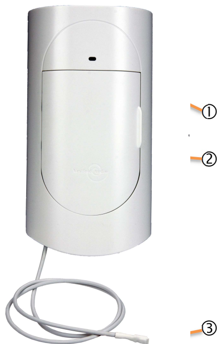
Figur 1 Forside