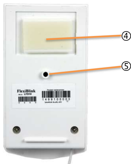
Figur 2 Bakside