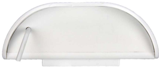
Figur 3 Bunn med mikrofon på ledning