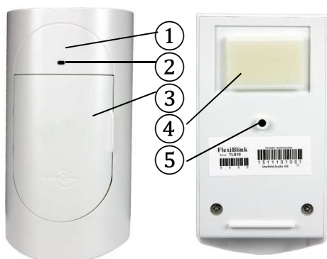
Figur 1 Forside