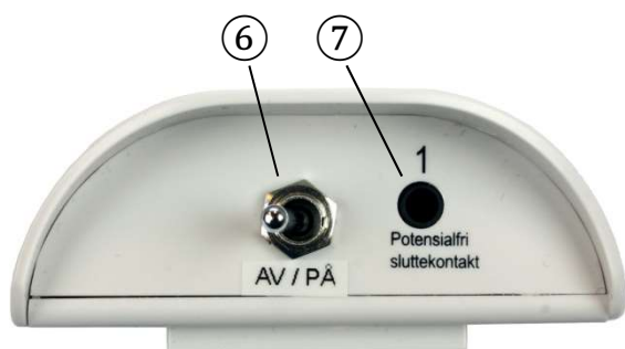
Figur 3 Bunn med inngang