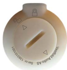
Lokket er nå ulåst og kan vippes ut.