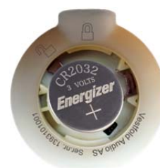
Batteriet legges i batterilommen

Sett batterilokket på plass. Med mynten trykker du lokket litt ned og vrir det mot høyre (med klokka) til pilen peker direkte på symbolet for låst batterilokk.