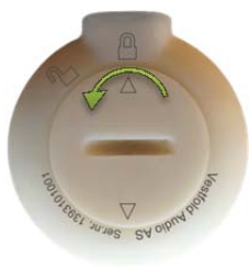
Åpne: Vri mot venstre.

Batterilokket åpnes eller lukkes ved å sette en passende mynt i sporet og vri. Batteriet har to store flater. På den ene siden er det tekst. Legg batteriet i batterilommen slik at teksten vender opp.