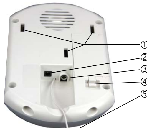
Figur 2 Baksiden