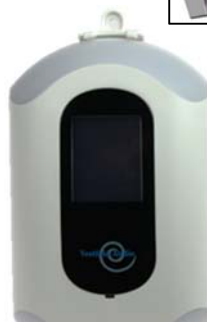
Figur 9 Låse med braketten