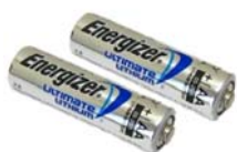
2 stk. Litium AA batterier