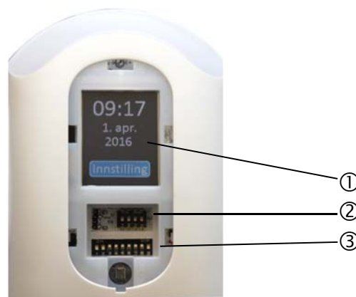
Figur 3 Under lokket på forsiden