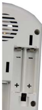
Figur 4 Batterirommet

Begge batteriene skal monteres samme vei.