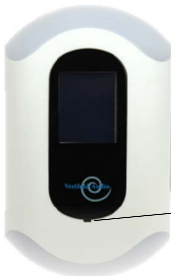
Figur 1 Framsiden