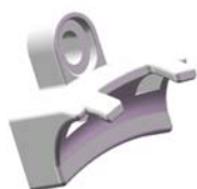
Låsebrakett for vegg