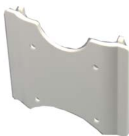
Festebrakett for vegg