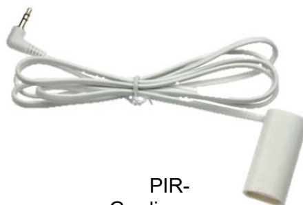
PIR- Gardinsensor med tilhørende spritserviett