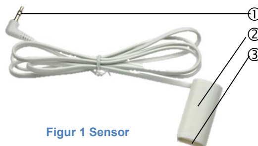
Figur 1 Sensor