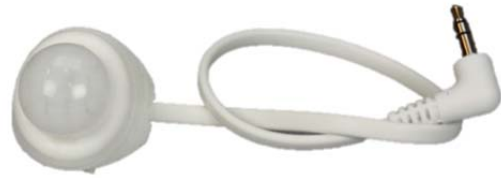
PIR Mini med tilhørende spritserviett