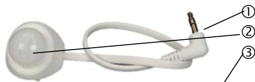
Figur 1 Sensor