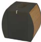
MIKLAD m/ 1 ladebrønn

Indikatorlampen lyser med fast, rødt lys under lading, og skifter til fast, grønt lys når batteriet er helt oppladet.